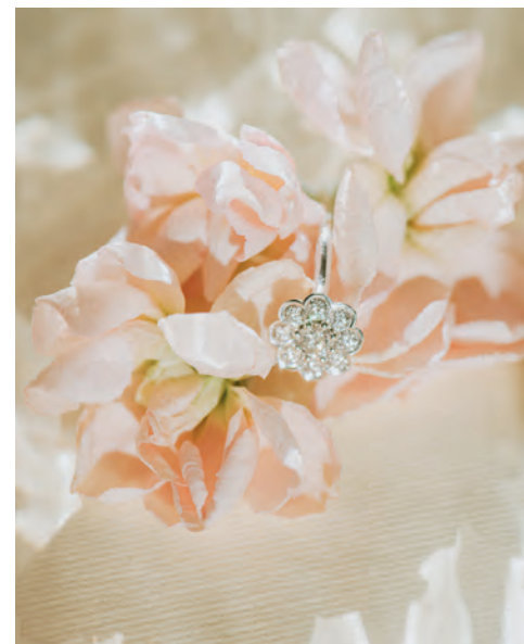
Bague brillant de 0.30 ct, 8 brillants 0.62 ct, monture en or blanc palladié 3.26 gr, 3 750 €