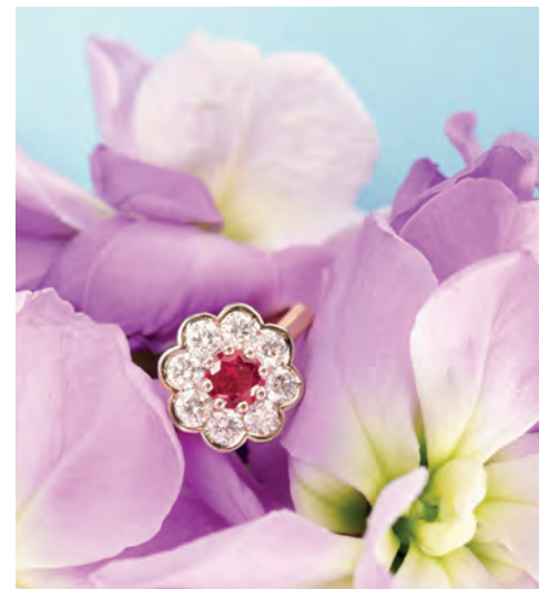
Bague rubis de 0.40 ct, 8 brillants 0.62 ct, monture en or bicolore 3.16 gr, 2 950€

Pendentif saphir de 0.57 ct, 10 brillants 0.62 ct, monture et chaîne en or blanc 4.23 gr, 2 700€ Bague émeraude de 0.34 ct, 8 brillants 0.63 ct, monture en or, bicolore 3.07 gr, 3 250€ Pendentif brillant de 0.30 ct, 8 brillants 0.62 ct, monture en or blanc 3.56 gr, 3 375€ Pendentif saphir vert de 0.61 ct, 10 brillants 0.62 ct, monture et chaîne en or jaune 4.22 gr, 2 700€ Pendentif saphir rose de 0.53 ct, 10 brillants 0.62 ct, monture et chaîne en or rose 4.19 gr, 2 850€