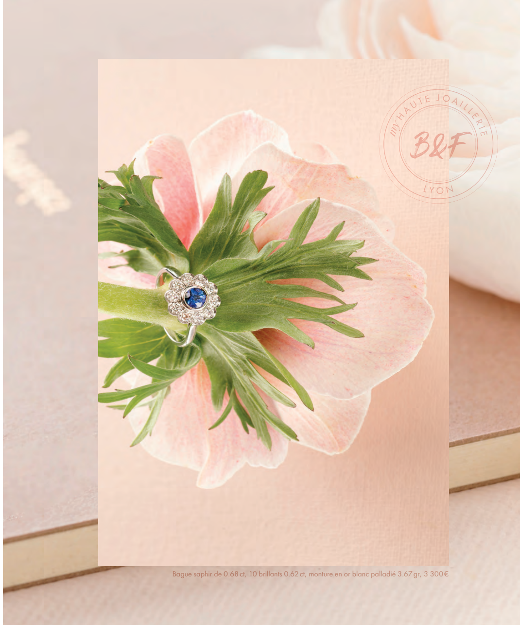
Bague saphir de 0.68 ct, 10 brillants 0.62 ct, monture en or blanc palladié 3.67 gr, 3 300€