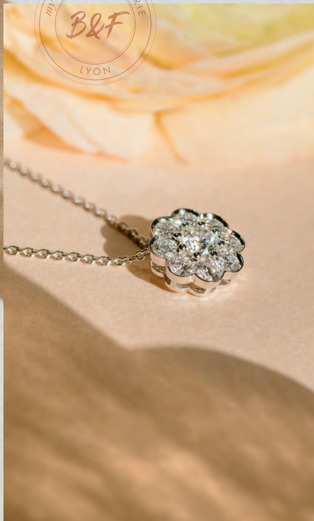
Pendentif brillant de 0.30 ct, 8 brillants 0.62 ct, monture en or blanc 3.56 gr, 3 375 €