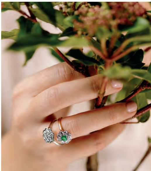
Bague brillant de 0.30 ct, 8 brillants 0.62 ct, monture en or blanc palladié 3.26 gr, 3 750€ Bague émeraude de 0.34 ct, 8 brillants 0.63 ct, monture en or bicolore 3.07 gr, 3 250€

UN PARFUM D'AMOUR FLOTTE DANS L'AIR PRINTANIER. LES SENS SONT DAVANTAGE EN ÉVEIL, STIMULÉS PAR LES PREMIERS RAYONS DU SOLEIL, UN VENT DOUX QUI SE LÈVE ET LE CHANT ENCORE DISCRET DE L'HIRONDELLE. NOTRE COLLECTION A ÉTÉ IMAGINÉE COMME UNE ODE AU PRINTEMPS, LA PLUS BELLE SAISON POUR DIRE « JE T'AIME ».